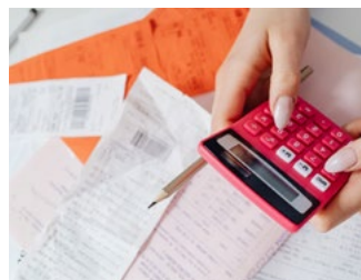
2 Tips voor de ondernemer in de inkomstenbelasting