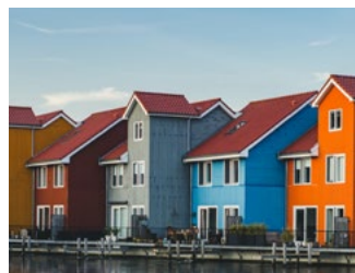
6 Tips voor de woningeigenaar