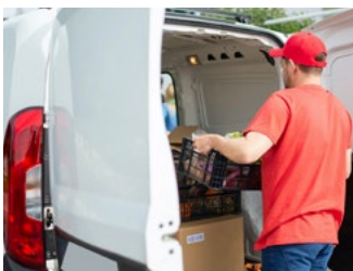
5 Tips voor de automobilist