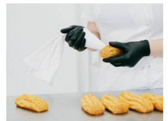
8 Tips inzake belasting-schulden coronacrisis en/of huidige (energie)crisis