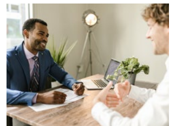
4 Tips voor werkgevers