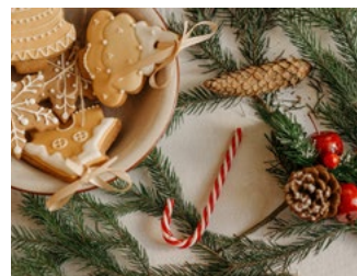
3 Tips voor de bv en de dga